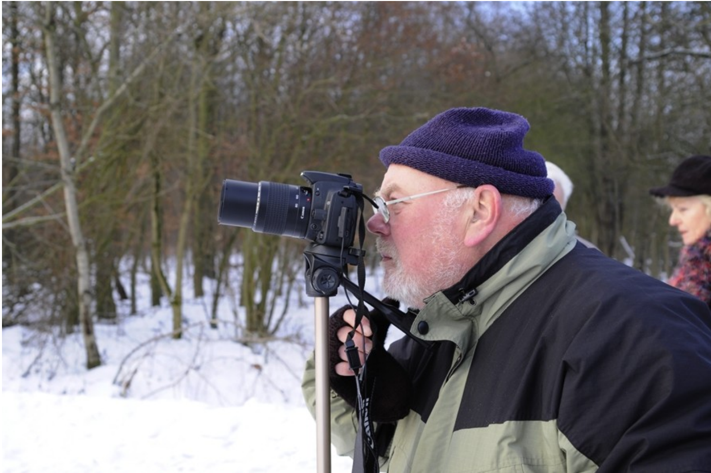
Bild 14. Konzentration...