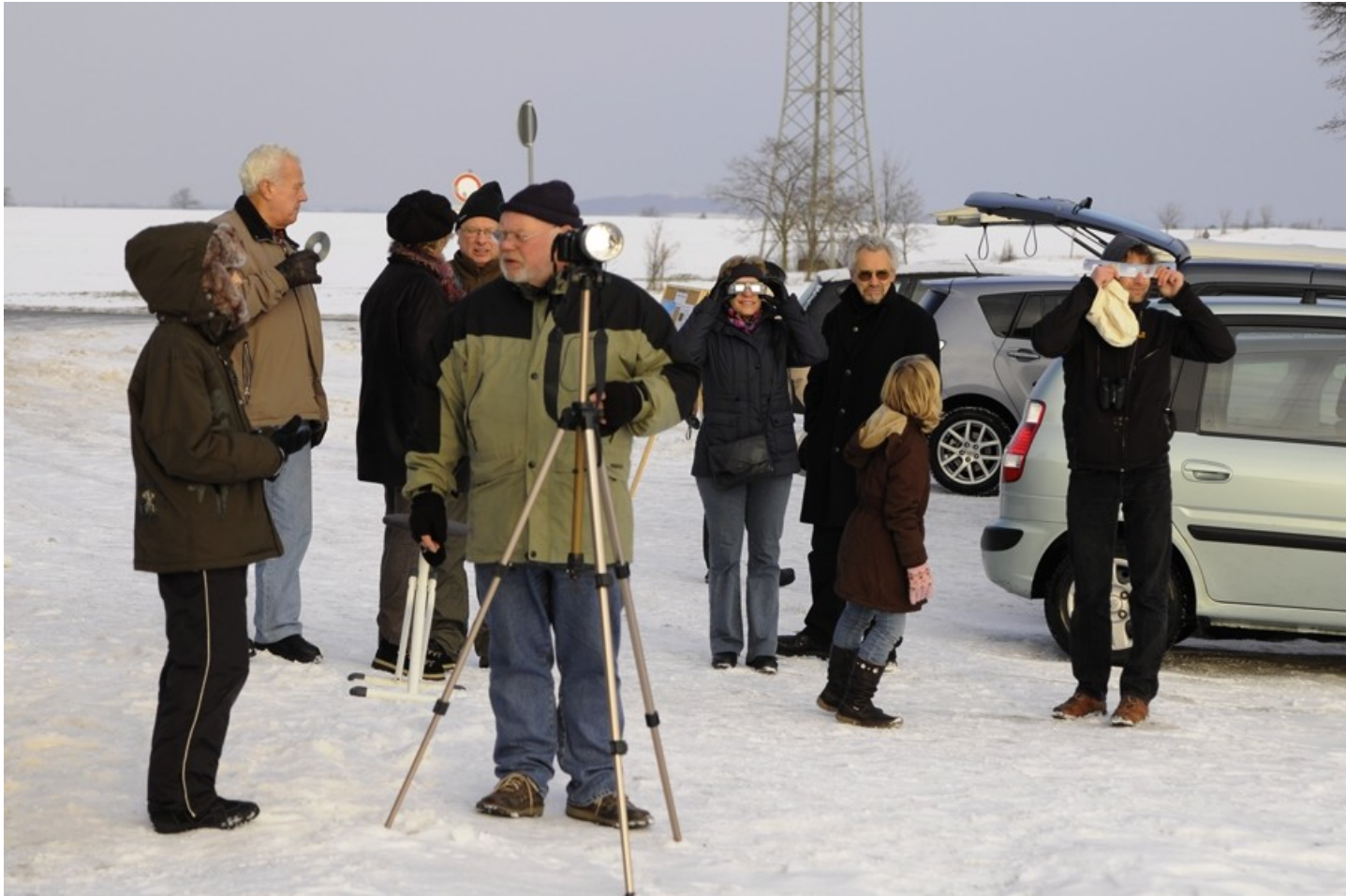
Bild 16. Schließlich gab es viele von uns und noch mehr Besucher.