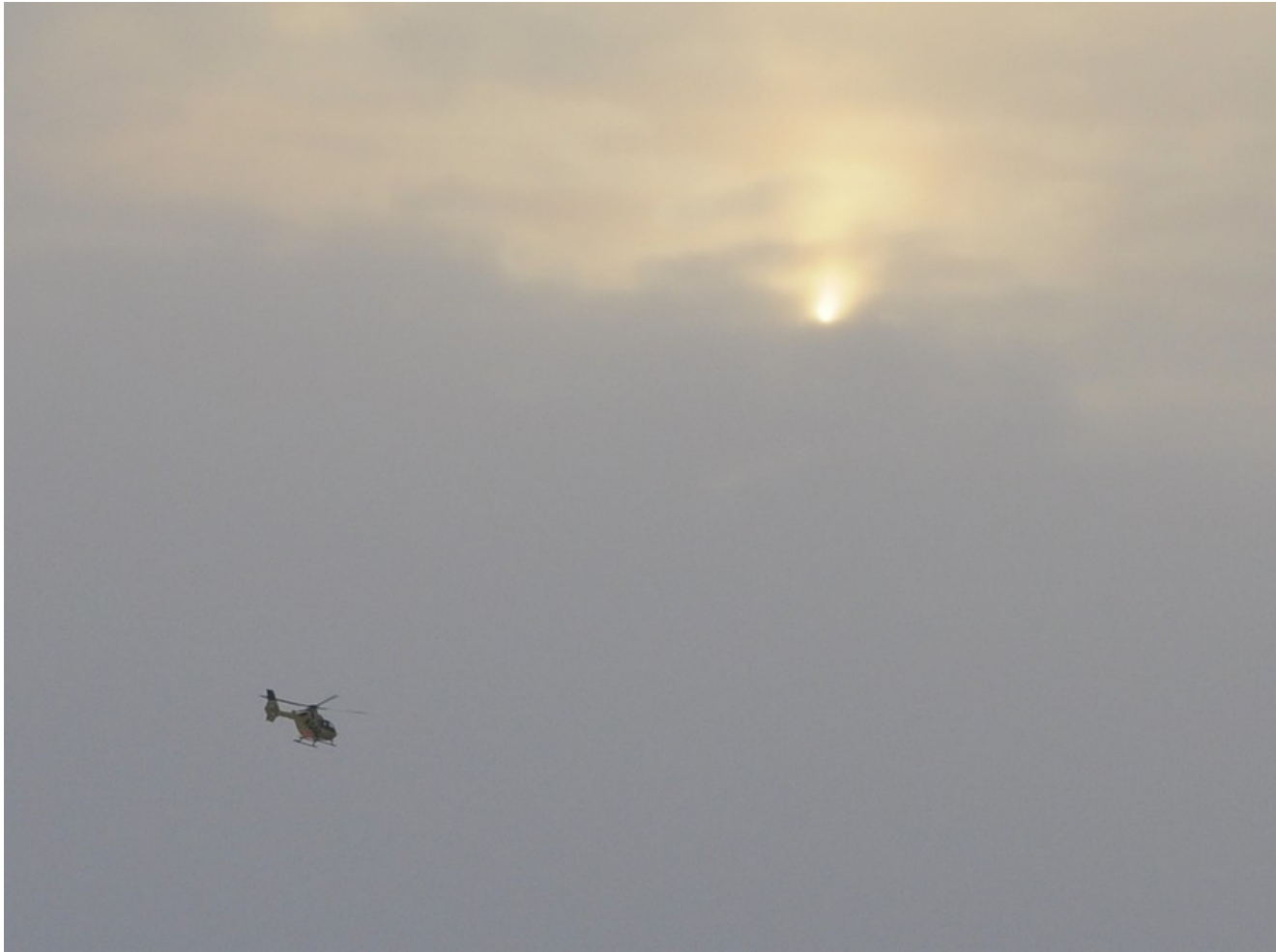
Bild 7. Es tut sich wirklich etwas. Die Jungs vom ADAC klären das.