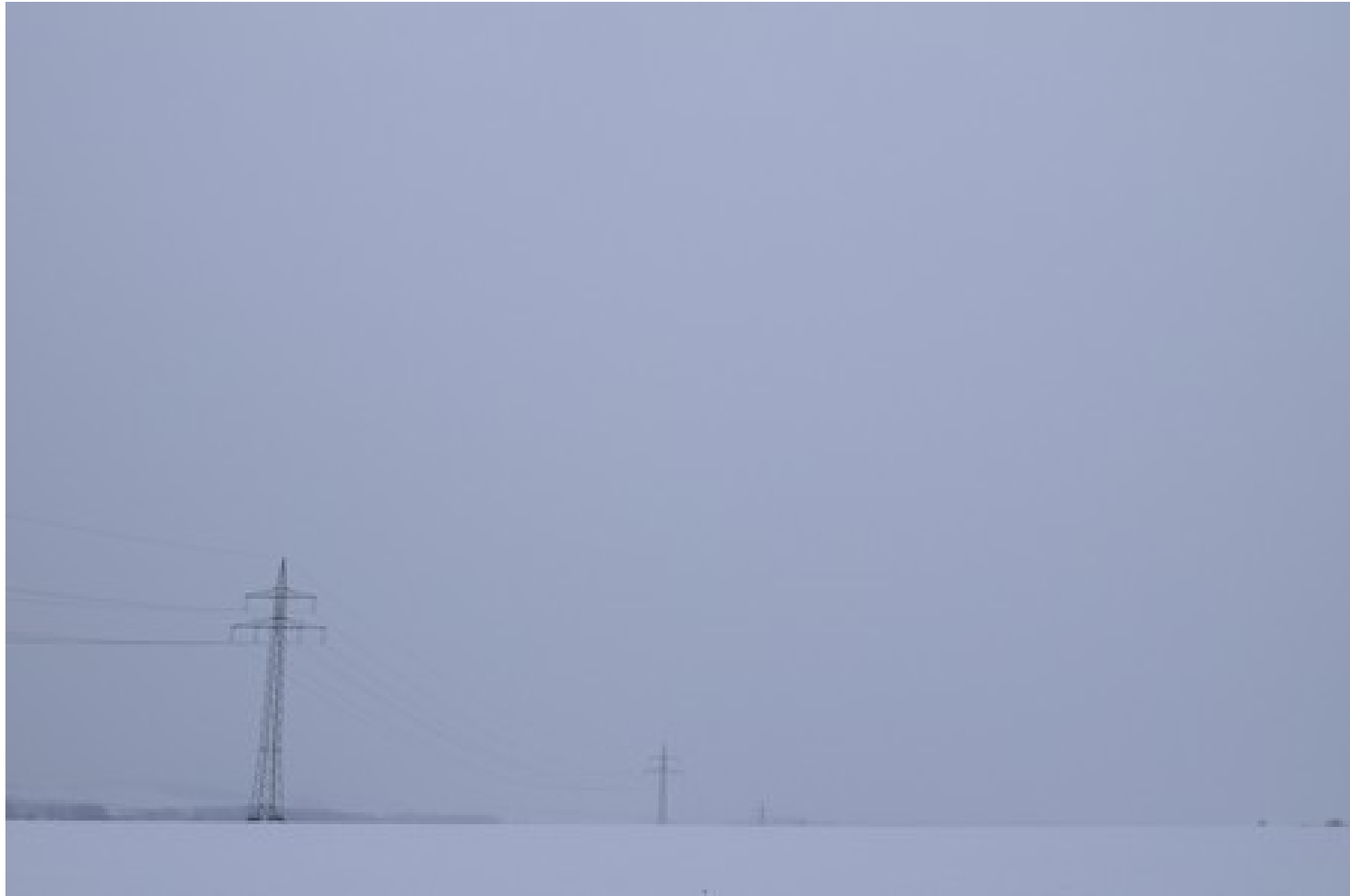
Bild 5. Nichts...