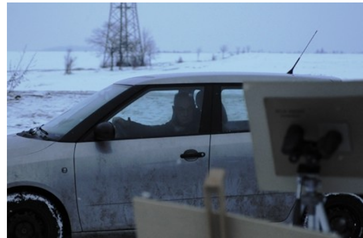
Bild 2. Es kommen immer wieder neue dazu, es gibt aber kaum Hoffnung