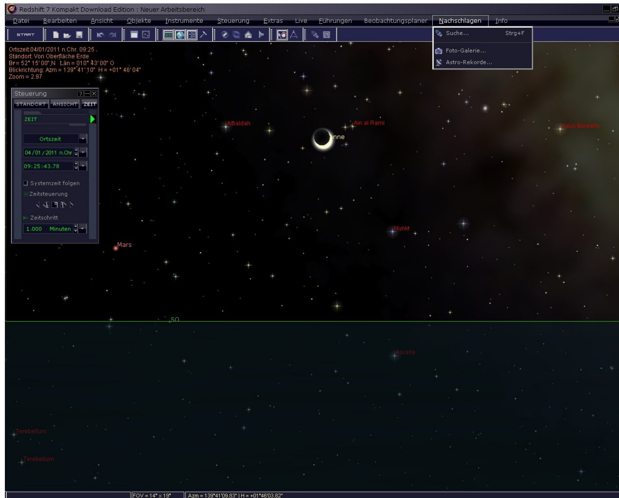
Bild 1. Himmelsausschnitt in Richtung Süd-Osten am 4 Januar 2011, ungefähr 09:25 Uhr