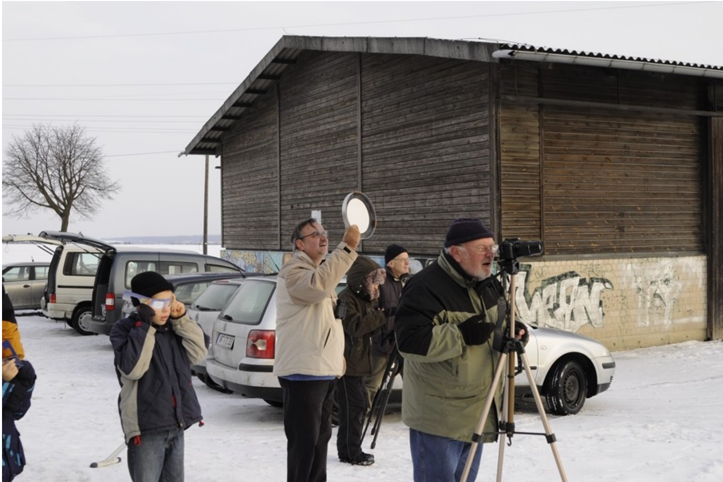
Bild 9. Es geht los, alle auf die Stationen.