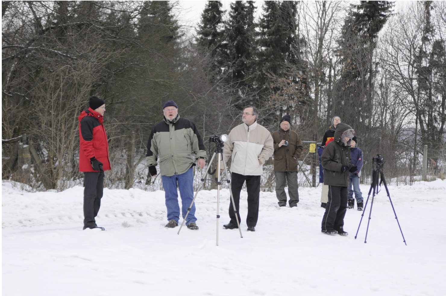
Bild 8. Hoffnung wächst, es gibt auch erste Zuschauer.