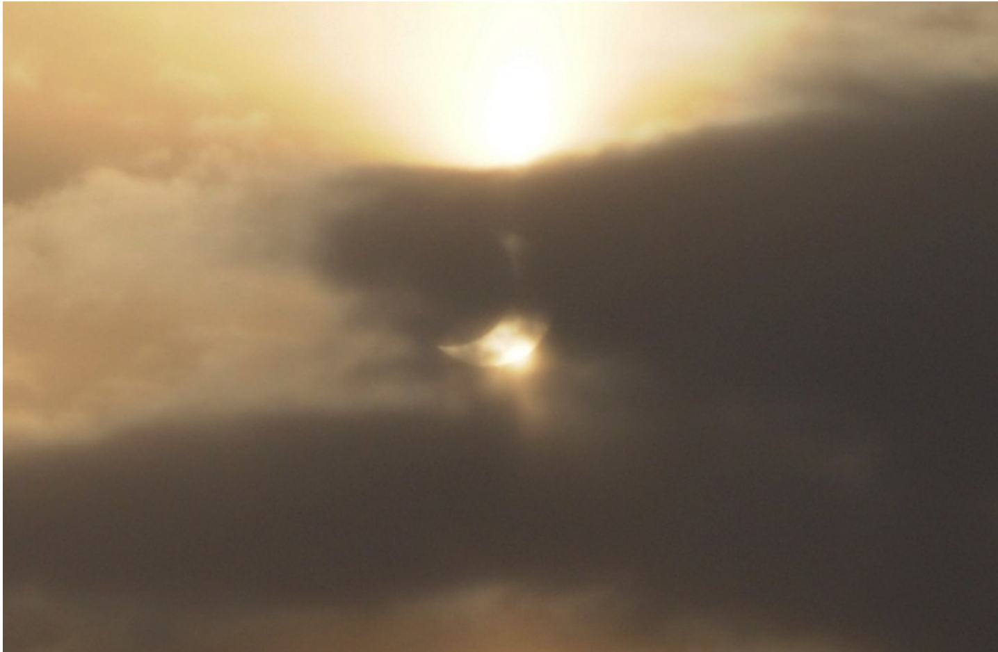
Bild 12. Ein gelungenes Bild mit verringerter Luminanz zur Kontraststeigerung.