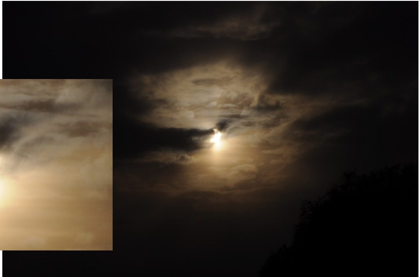
Bild 15. Aufgrund der direkter Lichtmessung die Umgebung stark abgedunkelt (links eine Vergrößerung).