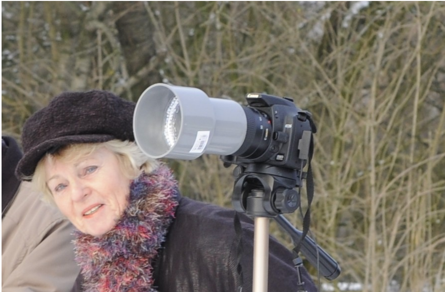
Bild 13. Aufmerksame Betrachter erkennen hier Artikel aus dem Baumarkt.