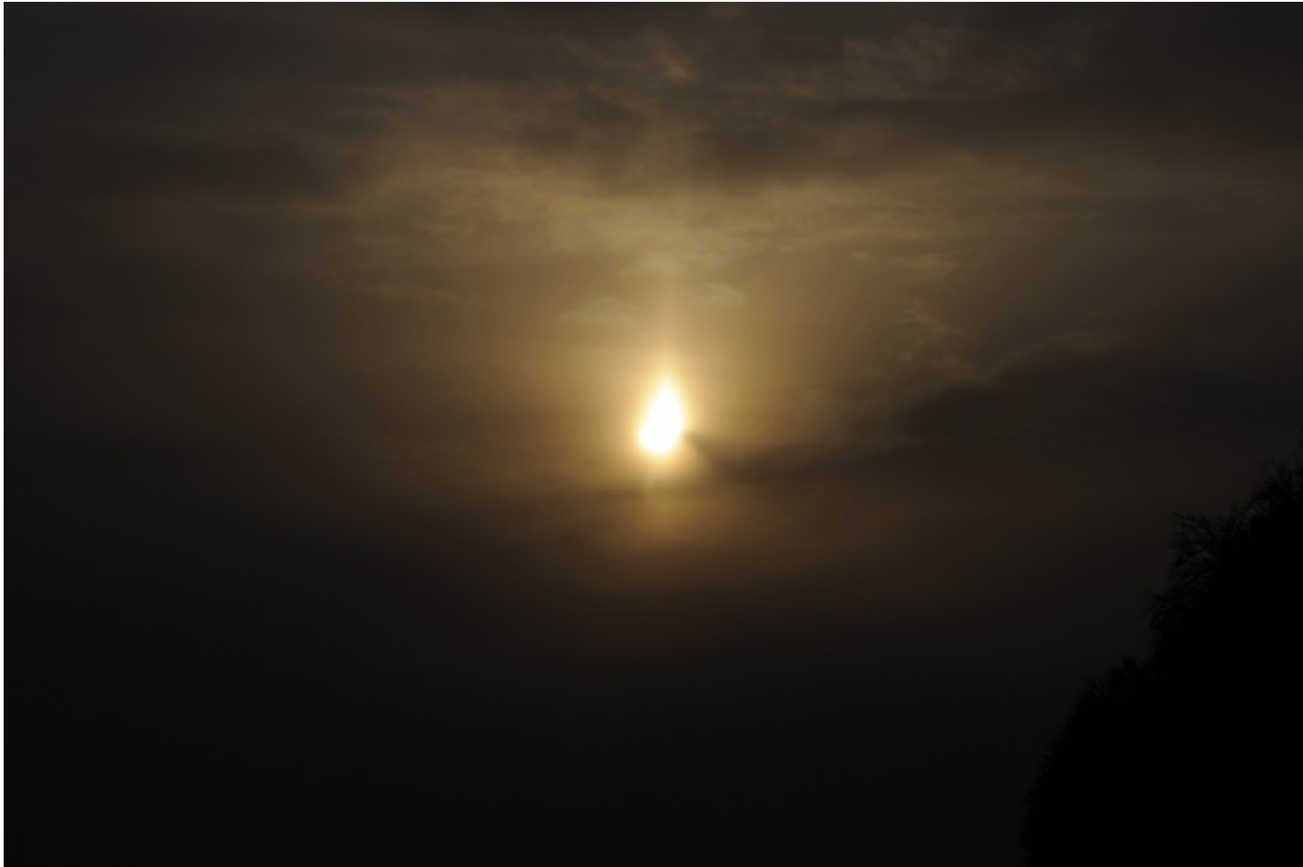
Bild 11. Ein Foto mit unnatürlichen Kontrasten und ausgebrannt.