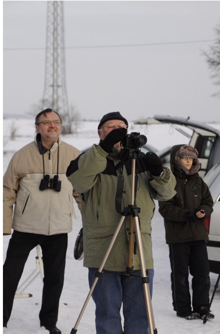
Bild 10. Finsternis ist schon im Gange. Die Kameras werden vorbereitet.